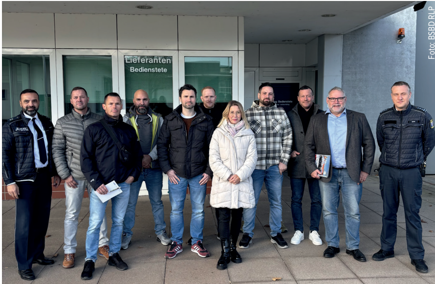
Mitglieder der AG Sicherheit mit den Kollegen der JVA Weiterstadt

Im November besuchten die Mitglieder der AG Sicherheit des BSBD Rheinland-Pfalz die JVA Weiterstadt, um sich einen Einblick zu verschaffen, wie in anderen Bundesländern in Puncto Sicherheit gearbeitet wird.