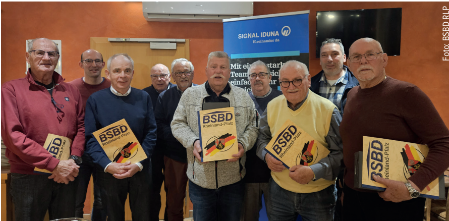
Die geehrten Mitglieder des OV Wittlich