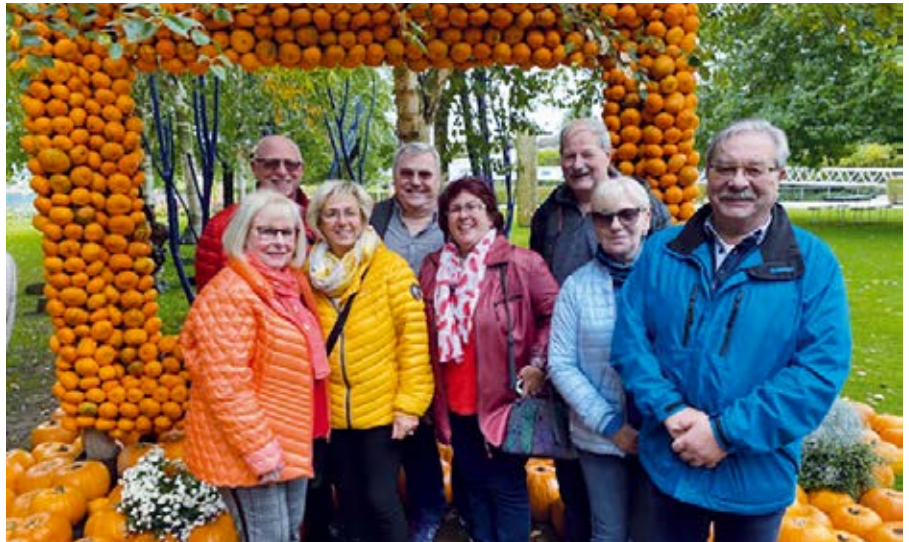
Die Ehemaligen mit Partner beeindruckte die Kürbisausstellung.

Heute werden das Gelände und die Gebäude von der Hochschule genutzt. Nach einem Besuch der sehenswerten Legoausstellung erfolgte bei noch schönem Wetter der Rundgang über das Gartenschau Gelände. Beeindruckt waren die BSBD -Besucher über die Kunstwerke der aktuellen Kürbisausstellung. Nach einem teilweise originalen pfälzi-