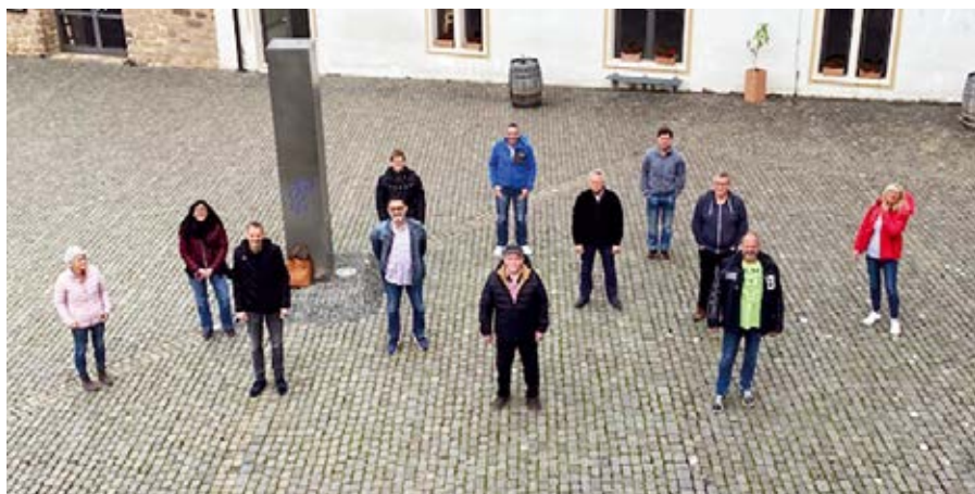
Schulungsgruppe des Justizvollzuges.

Die letzte Personalräteschulung in der derzeitigen Amtsperiode hat Anfang November in der Bildungsstätte Marienland in Vallendar stattgefunden. ■